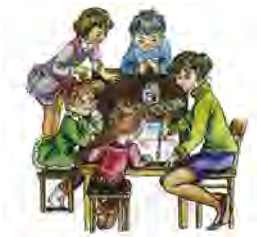
Рис. 1. К игре «Кто рядом со мной?»