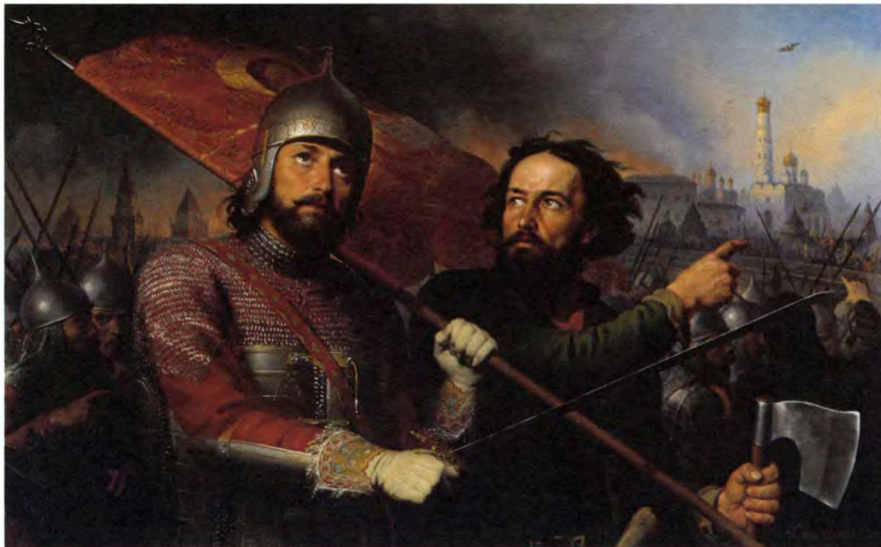
М. Скотти. Минин и Пожарский