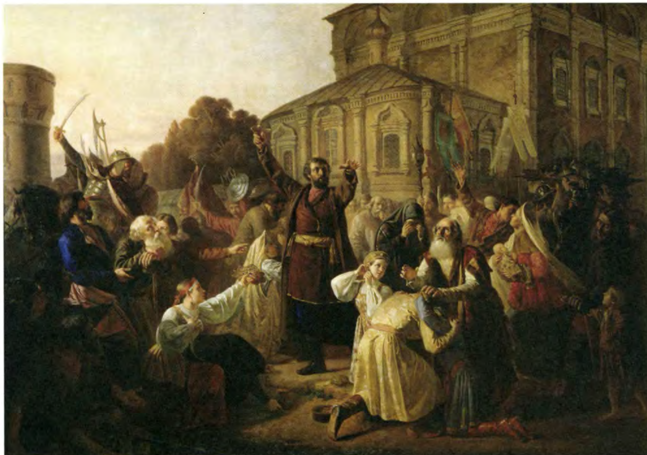
М. Песков. Воззвание Минина к нижегородцам в 1611 году