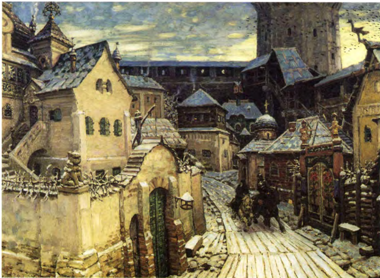
А. Васнецов. Гонимы. Ранним утром в Кремле. Начало XVII века